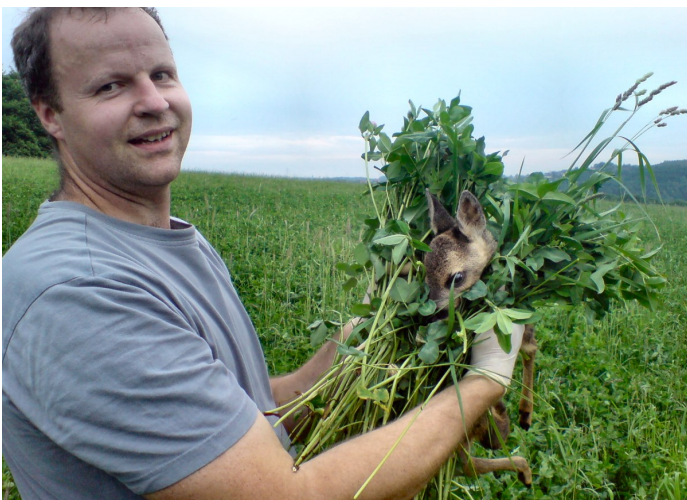
Ein Rehkitz - die Rettung vor dem Mähwerk

Als Hege werden im Jagdrecht alle Maßnahmen zur Sicherung und Verbesserung der Lebensgrundlagen des Wildes bezeichnet. Die Hege ist wesentlicher Bestandteil des als "Waidgerechtigkeit" bezeichneten Selbstverständnisses der Jagd und einer verantwortungsvollen, auf nachhaltige Fürsorge gegründeten Nutzung des Wildes in Schwelm.