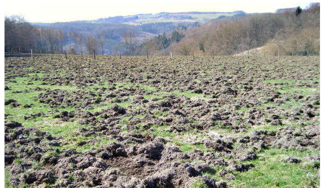
Intensive und grossflächige Schäden durch Wildschweine

Auch das Jagdrecht verpflichtet die Schwelmer Jäger zur Erhaltung eines artenreichen und gesunden Wildbestandes durch nachhaltige Sicherung und Pflege der Lebensgrundlagen des Wildes. Diese Pflicht zur Hege erstreckt sich auch auf solche Wildarten, die zwar dem Jagdgesetz unterliegen, aber durch dessen Schonzeitregelung dauerhaft nicht bejagt werden. Eine besondere Aufgabe besteht zur Zeit darin, Wildschäden durch Wildschweine zu verhindern, deren Bestand in den letzten dramatisch zugenommen hat.