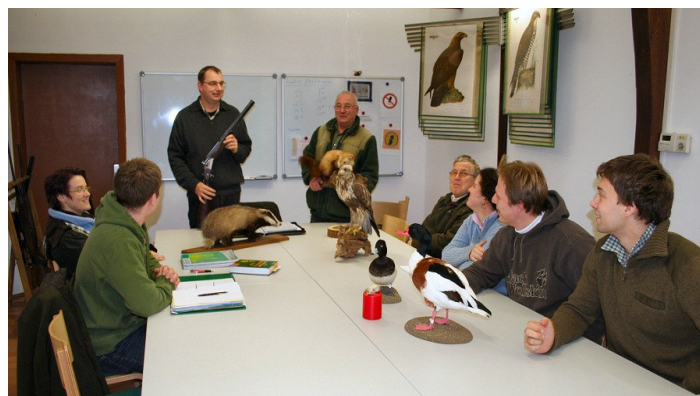
Jungjägerausbildung in der Kreisjägerschaft

Kenntnis der Tierarten, Wildbiologie, Wildhege, Naturschutz, Jagdbetrieb, waidgerechte Jagdausübung, Sicherheitsbestimmungen, Jagdhundewesen, Behandlung des erlegten Wildes, Wildkrankheiten, Grundzüge des Land- und Waldbaus, Wildschadenverhütung Waffentechnik, Führung von Jagd- und Faustfeuerwaffen, insbesondere sichere Handhabung, Gebrauch und Pflege der Waffen, Jagdrecht, Grundzüge und wichtige Einzelbestimmungen des Waffenrechtes, des Tierschutzrechtes, des Naturschutz- und Landschaftspflegerechtes. Anschließend steht dem erfolgreichen Abschluß nichts mehr im Wege!